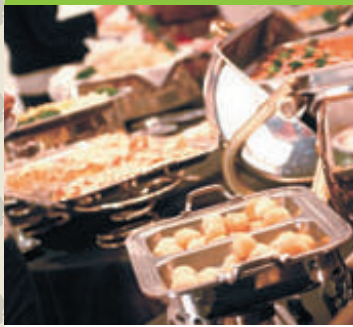
和食・洋食・中華・折衷各種 デザートビュッフェ / キッズビュッフェ