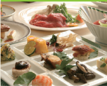
日本料理 / 会席・鍋会席