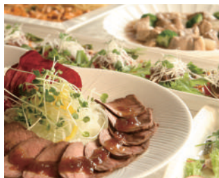
和食・洋食・中華・折衷各種