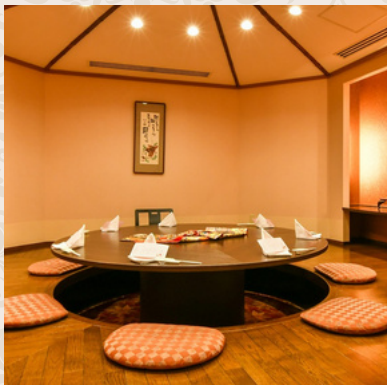
さくら 和式：4～10名様 (掘りごたつ式)

琵琶湖を見下ろすことができる「紅梅」は安土桃山時代を彷彿させるオリエンタルな空間。日本料理の伝統を守りつつ、創作的なテイストを取り入れた懐石は、目も舌も満足させるものばかり。小宴会や、法要の席、またご結納の場合、お飾りを眺めながらご会食いただける場所としてたいへん好評です。