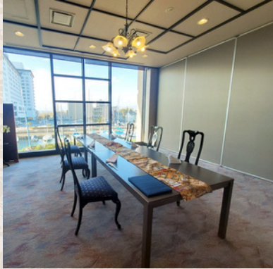
白梅 洋式：6～24名様 (2部屋に仕切れます)

片面がガラス張りで、明るい光がさしこんでくる開放的なスペース。椅子とテーブルで、和食をカジュアルにお楽しみください。テーブルプランを変えて、ちょっとしたご婚礼披露パーティーも素敵。完全に個室となっているため、目的に合わせて、多様にお使いいただける便利な個室です。