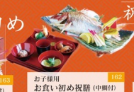
お子様用 お食い初め祝膳(中割付) 6,480円 ※器をホテルまで送却下さる方のみご利用ください。