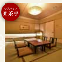
【楽茶亭】 ・6名様 ・茶室風個室