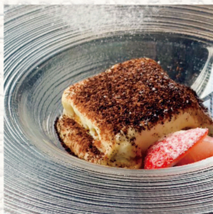
“クラシックティラミス”

ピスタチオとアーモンドの香り。 ナッツとドライいちじくの仄かな 甘味と食感をお愉しみください。