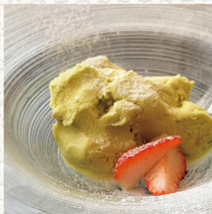
“ピスタチオジェラート”

定番のイタリアンデザート。 マスカルポーネの濃厚なコクと エスプレッソの苦みを お愉しみください。