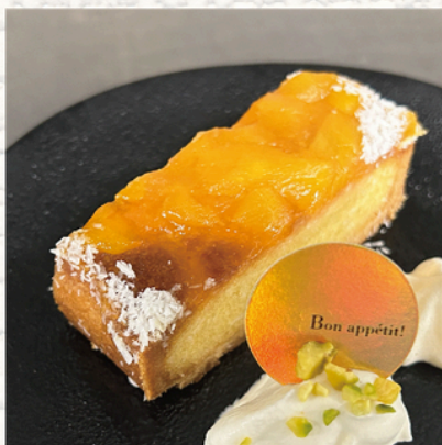
”トロピカルクロスタータ”