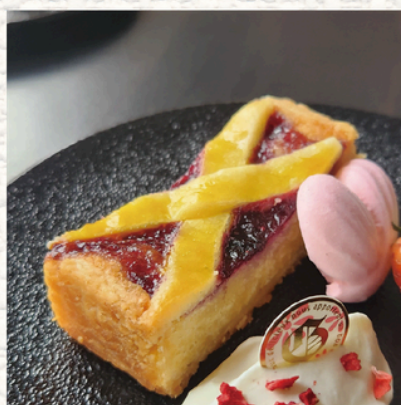
“ベリークロスタータ”