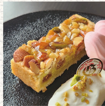
“ナッツクロスタータ”

ピスタチオとアーモンドの香り。 ナッツとドライいちじくの仄かな 甘味と食感をお愉しみください。